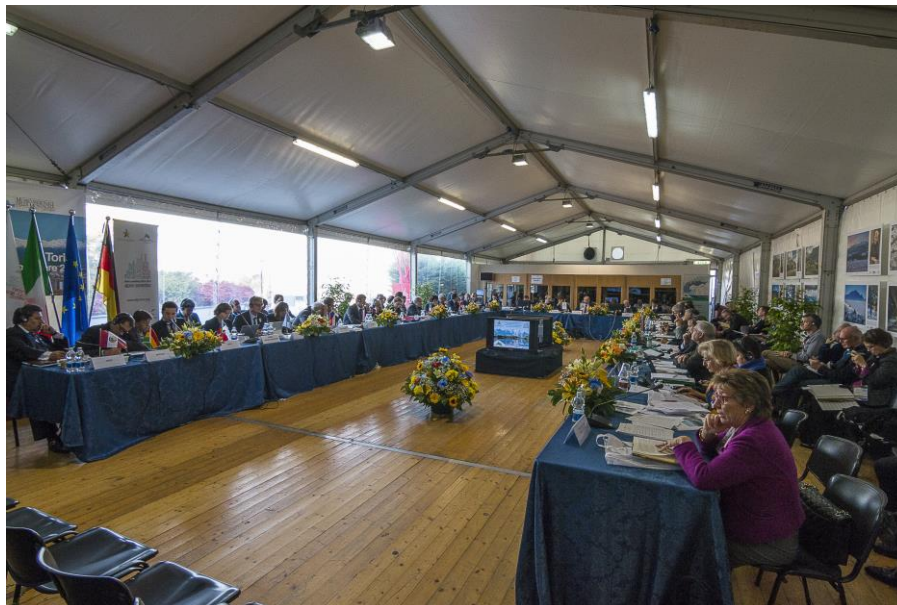
I delegati delle Parti contraenti e degli Osservatori intorno al tavolo della XIII Conferenza delle Alpi. La Conferenza ha avuto luogo all'interno di una tensostruttura ospitata nel Cortile Olimpico del Museo Nazionale della Montagna del CAI Torino.

THE ALPINE CONVENTION IS THE FIRST INTERNATIONAL TREATY FOR THE PROTECTION AND PROMOTION OF THE SUSTAINABLE DEVELOPMENT OF A CROSS-BORDER MOUNTAINOUS REGION italian presidency 2013-2014 alpine convention